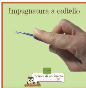
Impugnatura a coltello