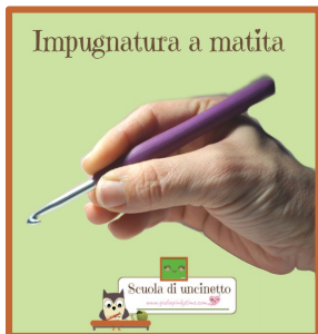
Impugnatura a matita